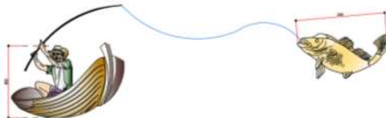
Pescador com banco/ peixe