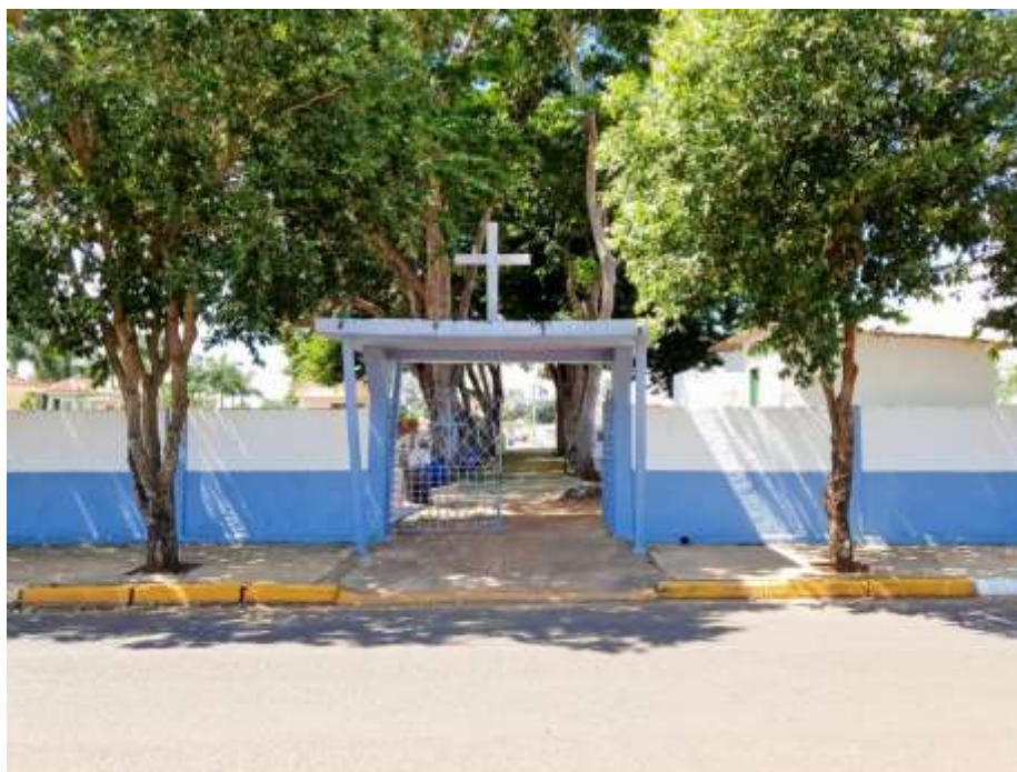
Acesso de entrada existente

O muro ao redor do acesso também será demolido e construído novamente conforme projeto arquitetônico (CPF). O município deverá fornecer a área totalmente limpa para a execução dos serviços.