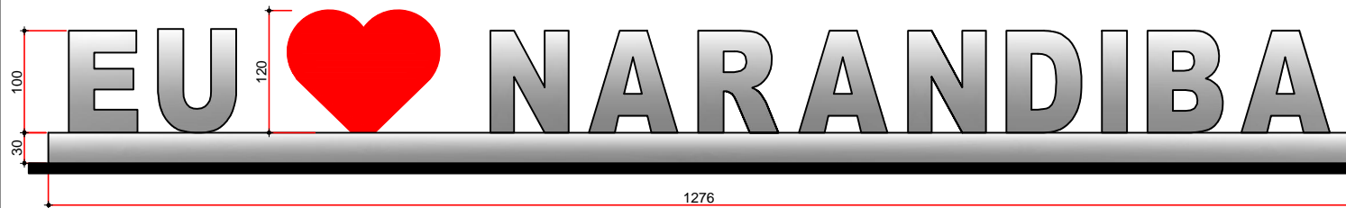
ELEVAÇÃO FRONTAL Esc. 1/25